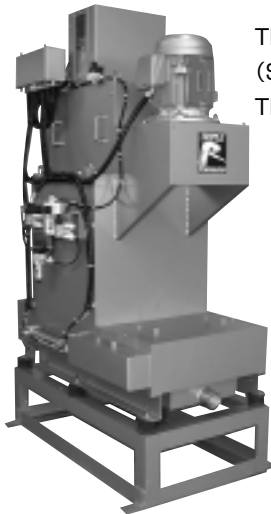
TRS-200A (SUS316仕様あり) TR-17920